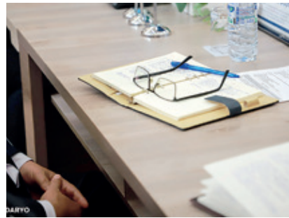
Президент қарори билан АБДУЛЛА АВЛОНИЙ номидаги педагогик маҳорат миллий институти ташкил этилади.