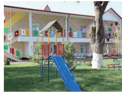
Президент фармони асосан, энг намунали боғчаларда ГИМНАСТИКА ХОНАЛАРИ ташкил қилинади.