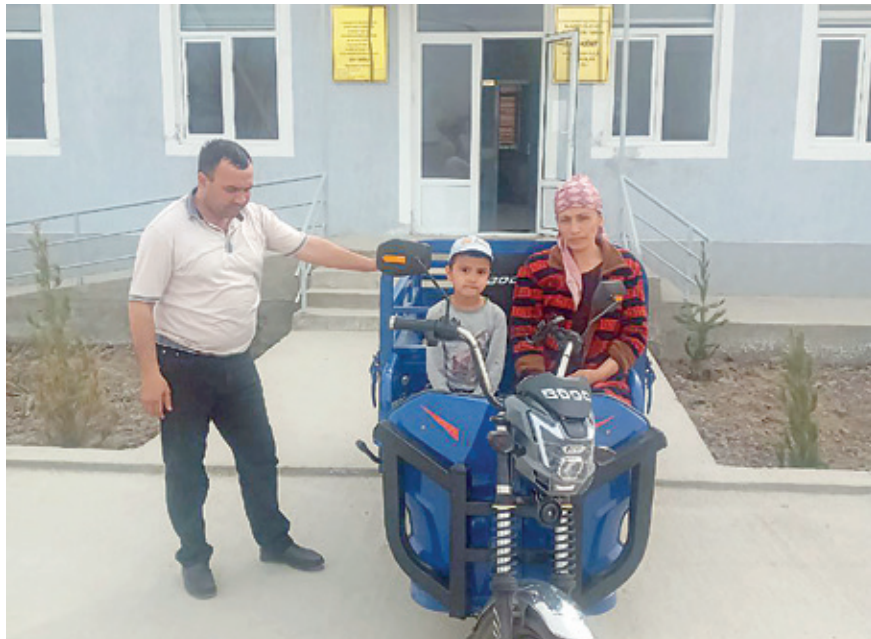
иссиқхона куриб бериш имкониятимиз борлигини билдирдим. Таклифим маъқул келди. Кўп ўтмай, оила ватанга қайтди. Ваъдага кўра, кредит асосида аввал пишириқ учун асбоб-ускуна билан таъминладик. Кейинги босқичда иссиқхона куриб бердик.