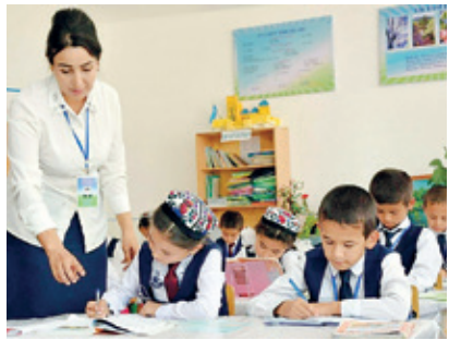
“Қори Ниёзий номидаги Тарбия педагогикаси миллий институтини ташкил этиш тўғрисида”ги ПРЕЗИДЕНТ ҚАРОРИ қабул қилинди.