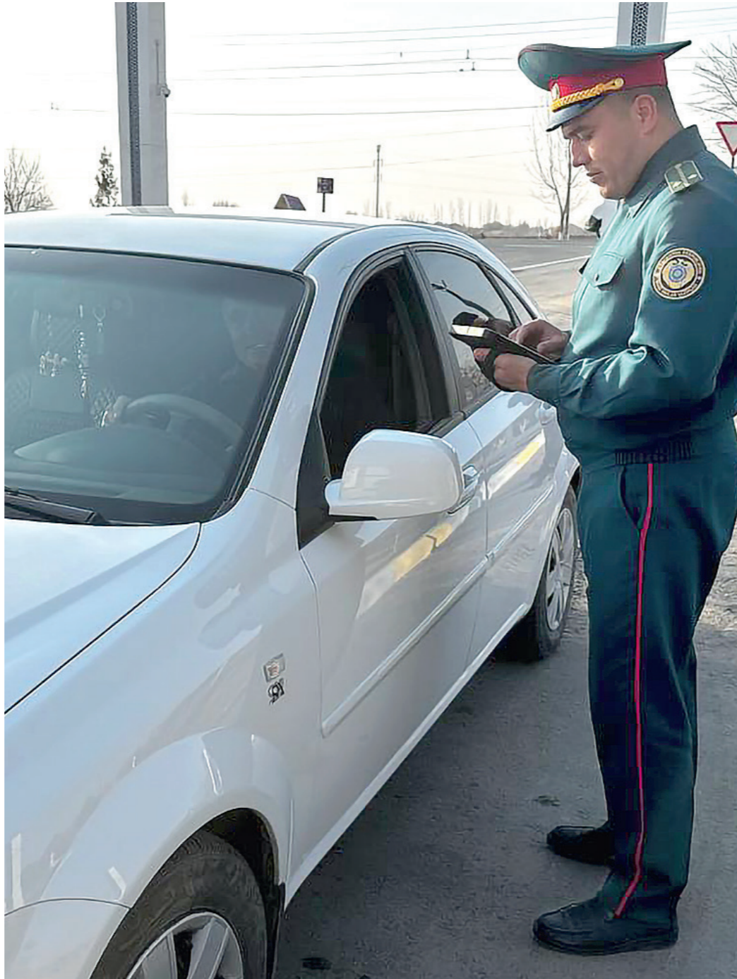
Агар бирор бегона шахс ёки автотransпорт воситаси маҳалла худудига кирса, планшетга хабар келади.

“Истиклол” маҳалласида уч мингдан зиёд аҳоли мавжуд. Худуддаги 29 та хизмат кўрсатиш шохбачаси аҳолининг барча юмушларини маҳалланинг ўзида ҳал этишга кўмаклашмоқда. 2 та мактаб, битта давлат, иккита нодавлат боғчаси 879 та оила фарзандларига таълим-тарбия бермоқда. “Баҳор” тўйхонаси халқнинг шукрона кунига хизмат қиляётган бўлса, “Оталар чойхонаси” кексаларни бир пиёла чой устида бирлаштирмоқда.