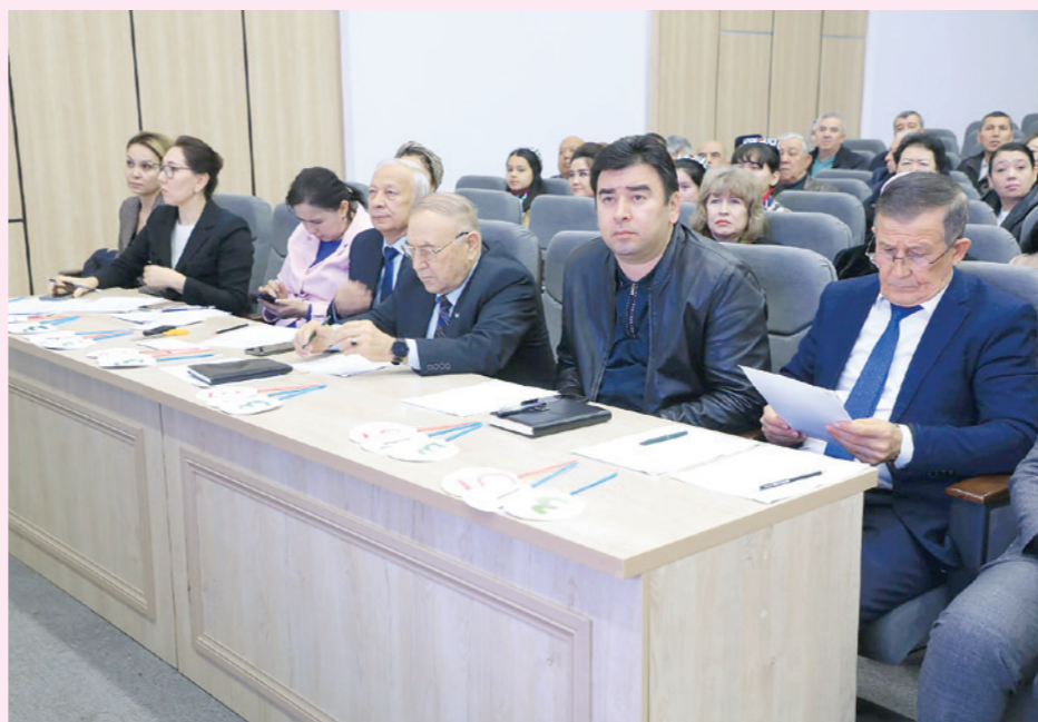
Республика маҳаллани қўллаб-қувватлаш кенгаши – ҳудудларда биринчи ўринни қўлга киритган 14 нафар маҳалла раисига «Энг намунали маҳалла раиси» фахрий ёрлиғи ва 10 миллион сўм миқдорда пул муқофоти ажратяди.

Уч босқичда ташкил этилган танловнинг дастлабки – сектор босқичи 19-25 февраль, иккинчи – туман (шаҳар) босқичи 26-29 февраль кунлари ташкил этилди. Унда 1-ўринни қўлга киритганлар учинчи – Қорақалпоғистон Республикаси, вилоятлар ва Тошкент шаҳар босқичида 5-9 март кунлари ўзаро беллашади.