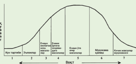
Manba: Making Meetings Work SECOND EDITION. John E. Troppman

Ушбу тартибда мажлис ва йиғилишларни ўтказиш унинг самарадорлигини ошириши, регламентга риоя этишига олиб келади.