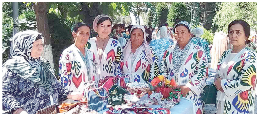
Маҳалламиздаги ҳар бир кўча маълум йўналишга ихтисослашган. Биттасида аёллар касаначиликнинг кўрпа-тўшак тикиш йўналишида меҳнат қилса, яна бошқасида сават тўқиш билан шуғулланади. Қолаверса, асарличилик, паррандачилик қиладиган кўчалар бор.

Маҳалламиздаги ҳар бир кўча маълум йўналишга ихтисослашган. Биттасида аёллар касаначиликнинг кўрпа-тўшак тикиш йўналишида меҳнат қилса, яна бошқасида сават