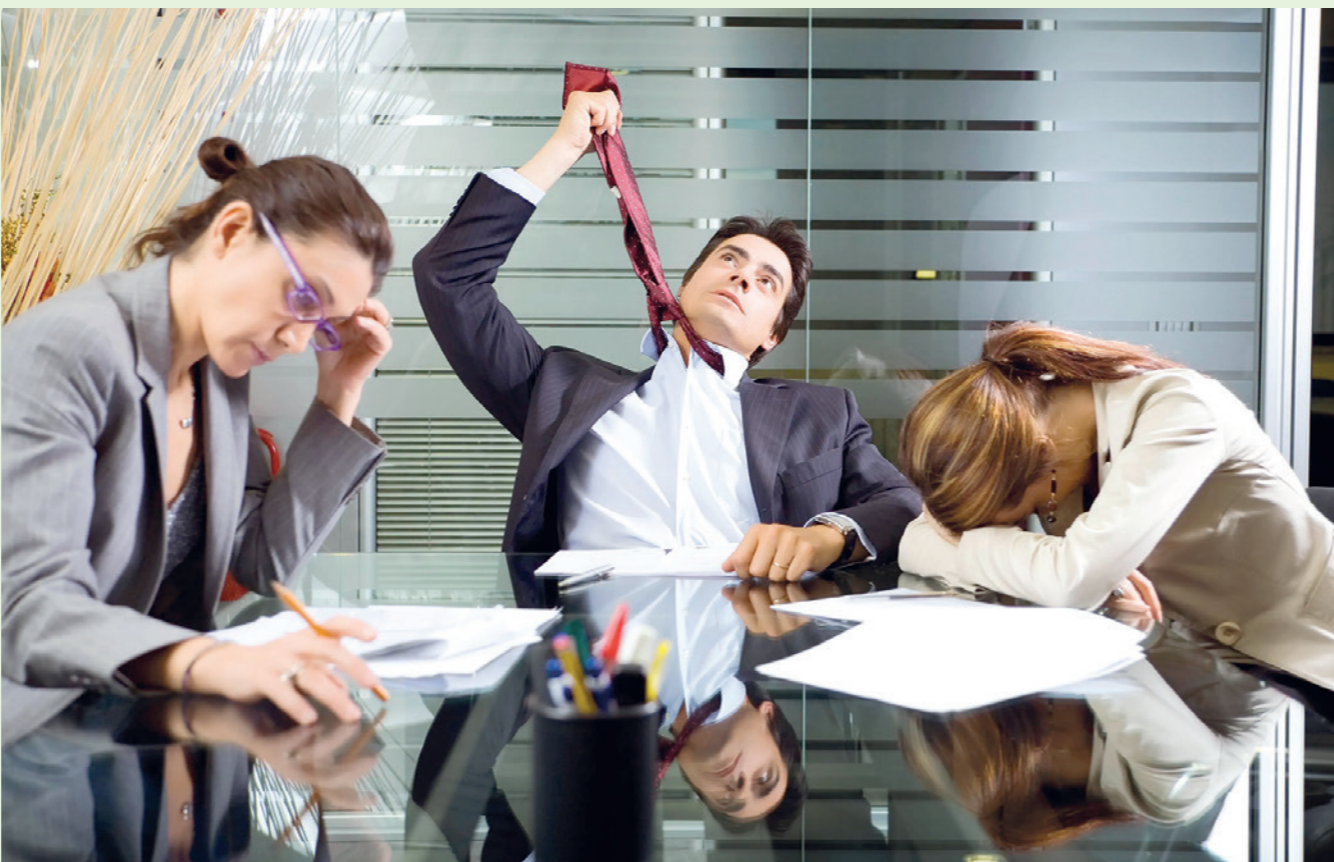
Мажлис ва йиғилишларсиз кунларни белгилашни натижалари

Тадқиқот доирасида 1000 тадан ходимга эга 76 та корхона орасида сўров ўтказилган. Ушбу корхоналарнинг деярли ярми (47 фоизи) ҳафтада икки марта йиғилишларсиз кунларни белгилашга қарор қилди, қолган 40 фоизга камайган. 35 фоиз корхоналар ҳафтада уч кунли мажлисларсиз кунлар деб белгилади, 11 фоиз эса тўрт кунли, қолган 7 фоиз корхоналар учрашуларни бутунлай йўқ қилди.