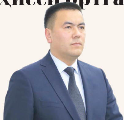
Ганийжон СОЛИЕВ, Бағдод тумани ҳокими.