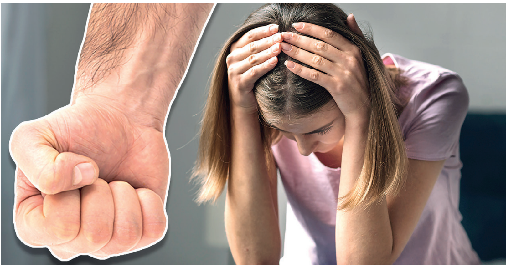
Оилавий зўравонлик масалалари бўйича психологларни тайёрлаш ва қайта тайёрлаш курсларини жорий этиш зарур.

Оилавий зўравонлик жамиятда кенг тарқалган, қийин ҳолат ва мураккаб муаммолардан биридир. Унинг салбий оқибатлари шахслар учун, бутун жамият учун жиддий хавф демекдир. Масалага ўз вақтида жиддий чора кўрилмаса, эртага у чуқур илдиқ отиб, бундан-да аянчли ҳолатларни юзага келтириши аниқ.