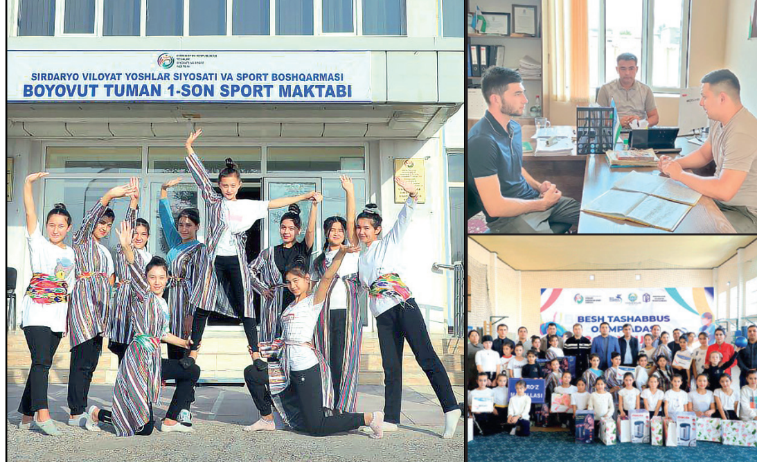
БОЁВУТ ТУМАНИДАГИ “ИЖДОКОР” МАҲАЛЛАСИ ЁШЛАР ЕТАКЧИСИ ФАОЛИЯТИДАН ЛАВҲАЛАР.

2022 йилдан бери ёшлар етакчиси лавозимида ишлаб келаман. Дастлабки иш бошлаган кунимдан, ёшлар муаммосини ўрганиш, унга ечим топишга ҳаракат қиламан. Айниқса, 2023 йилда ўтказилган хатлов натижасида 34 нафар