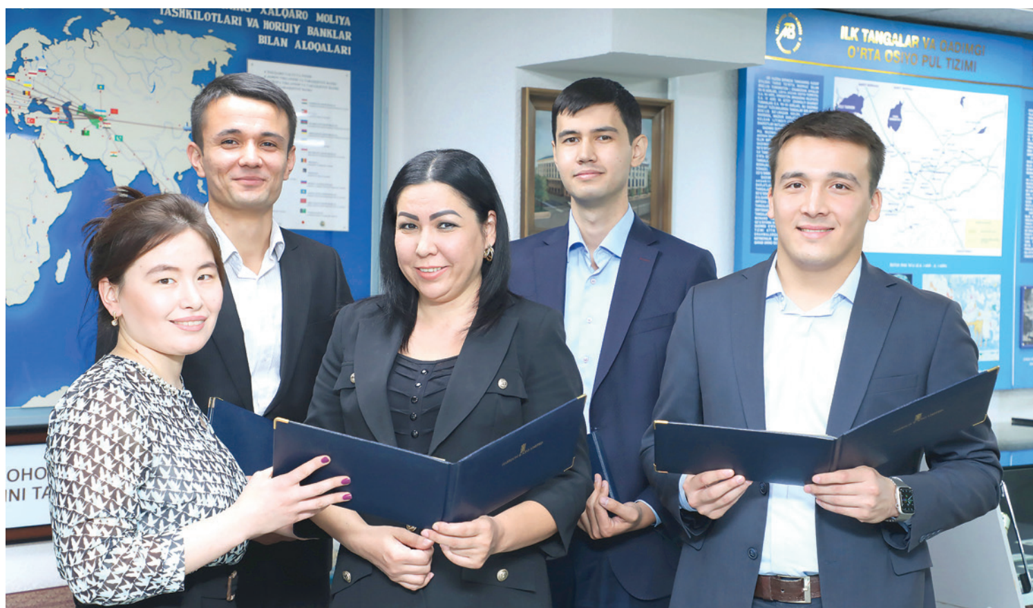
"Мақтаб фақат таълим беришга масъул" деган қарашдан воз кечиш лозим.