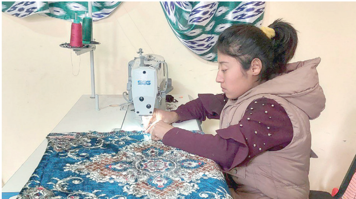
Ногиронлиги бўла туриб, қайсидир соҳада банд бўлган, яхши ютуқларга эришаётган инсонларни атрофдагиларга кўпроқ намуна сифатида кўрсатишимиз керак.