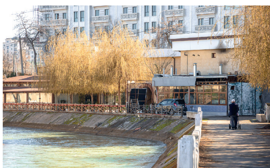
Ўтган йили юртимизда 36 та маҳалла янгидан ташкил этилган.

Бу маҳаллада ижтимоий-маънавий муҳит барқарорлигини таъминлашга салбий таъсир кўрсатади