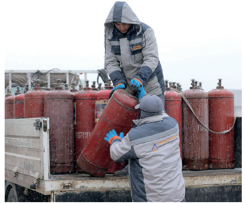
ХУДУДЛАРДА АҲОЛИГА ГАЗ ТАРҚАТАДИГАН МАСЪУЛ ШАХСЛАРНИНГ ТАЪМИНОТ ХАРИДИ УЧУН ИСТЕЪМОЛЧИДАН НАҚД ПУЛ ҚАБУЛ ҚИЛИШИГА ЧЕК ҚўЙИЛДИ.

Сирасини айтганда, бугун рақамли иқтисодиёт, автоматлаштирилган тизим истеъмолчи ва таъминотчи ўртасида ишончли кўприк вазифасини бажараётир.