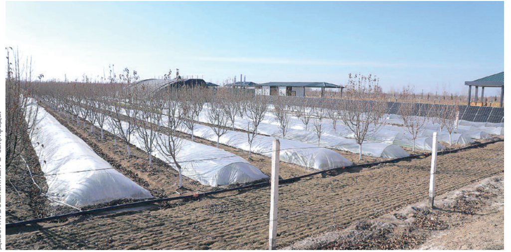
Давом. Бошланчи 1-саҳифада.

Ана шунда Президент қайд этганидек, ота-онада масъулият, ўқитувчида мажбурият, ўқувчида ишонч, таълим ва тарбияда сифат, маҳаллада назорат бўлади.