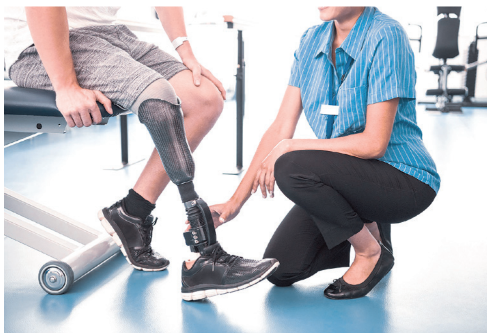
Протез-ортопедия мосламалари ва реабилитация қилишнинг техник воситалари турлари 18 тадан 30 тага кенгайтирилади.

2024 йил 1 майдан: • протез мосламалари ва реабилитация воситалари харидаи учун давлат томонидан муҳтож шахсларга қоплаб бериладиган маблағлар миқдорини бозор конъюнктурасидан келиб чиқиб, ўртача 3 бараваргача, айрим воситаларнинг турлари 10 бараваргача оширилади; • ногиронлиги бўлган шахсларнинг протез мосламалари ва